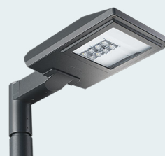
O55-250 LED 6500 DALI 830 MBA BL NightDim-ohjaus, WBA-optiikka