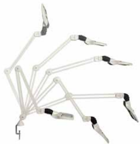
Maksimaalinen vaak- ja pystyliike.

Tasapainottuvan varren joustavuus ja valaisinosan ja varren yhdistävä joustava nivel tekevät valaisimen täsmällisestä aseoinnista helppoa.