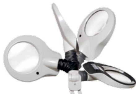
Valaisinosan ja varren välinen joustava nivel